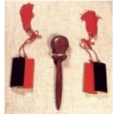
Kachi-kachi-yuchidaki japones_y castañuelas modernas